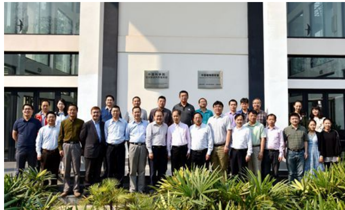
中国科学院药物创新研究院建设启动会合影

中国科学院药物创新研究院(筹)已于2016年底完成筹建验收,并获得优秀。2017年药物创新研究院正式进入建设期,为深入推进药物创新研究院各项工作,加强总部和分部协同发展,3月17日至19日,在中国科学院西双版纳热带植物园召开了“中国科学院药物创新研究院建设启动会暨中药民族药研讨会”。中科院重大任务局褚鑫与会指导,药物创新研究院总部(上海药物所)、西南分部(昆明植物所、昆明动物所、成都生物所、版纳植物园)、西北分部(新疆理化所、西北高原生物所、兰州化物所)以及西双版纳傣医医院等相关负责人参加会议,会议由药物创新研究院院长、上海药物所所长蒋华良主持。