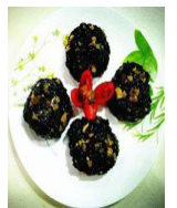
咸蛋黄榨菜乌米团