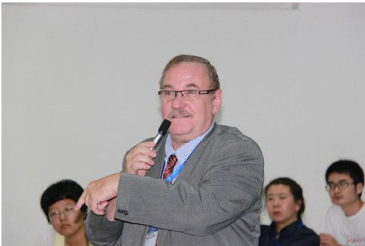
参会专家现场发言

为期两天的学术会议交流中，来自美国、日本、中国香港及中国大陆的20多位专家紧紧围绕微循环和气血研究做了精彩的学术报告。另外还展出了55份壁报，分9个部分进行了交流，学术氛围浓厚。本届大会交流了气血理论的科学内涵、研究方法等方面的最新研究成果，推动了气血理论与微循环理论、中医与西医的交流和互动。