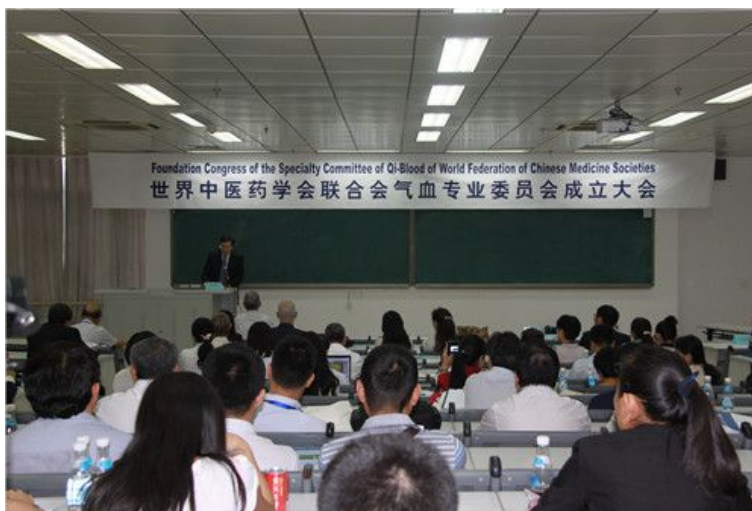
气血专业委员会成立大会现场

世界中医药学会联合会气血专业委员会成立大会暨气血研究国际学术会议于2014年9月5日-7日在北京大学医学部举行。本次会议由世界中医药学会联合会主办, 北京大学医学部中西医结合学系、北京大学医学部天士力微循环研究中心承办, 中国中西医结合学会微循环专业委员会、中国微循环学会痰瘀专业委员会、天士力控股集团有限公司协办。来自美国、英国、匈牙利、日本、韩国、中国香港及其他地区的气血和微循环研究领域的专家、学者200多人参会。