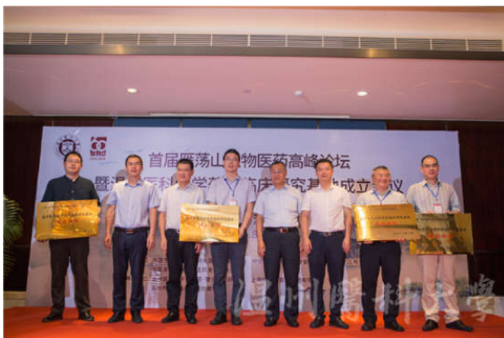
温州医科大学药学临床研究基地启动首批基地成员单位授牌仪式

会上，瓯海区人民政府、温州医科大学、温州市生物医药协同创新中心、上海新生源医药集团有限公司就共建温医大药学临床研究基地签署协议，附一医、附二医等首批8家药学临床研究基地授牌。根据协议内容，将按照“总体规划、分期实施、滚动发展”的原则，建设以新药临床研究、仿制药一致性评价、卫生适宜技术评价与临床验证为特色的临床研究技术平台，重点关注重大疾病防治的已上市药物的循证医学研究和真实世界临床研究，在区域内打造以药物临床研究为主的创新孵化平台。基地将有力促进高校的协同创新发