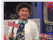
主持人吴宗宪被判刑