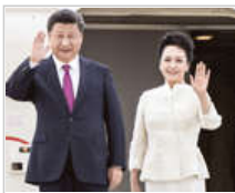
习近平和彭丽媛步出舱门