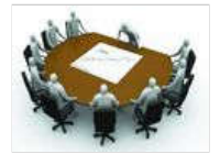
私募基金新规新在何处

唐山大地震40周年: 从一片废墟到世界百花园 美国一场“互黑”的政治闹剧 斯诺登: 美国曾批准网络攻击外国政党 我国新一代百亿亿次超级计算机启动研制