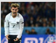
欧锦赛A组尘埃落定