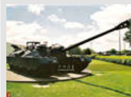
美军造百吨超重型坦克