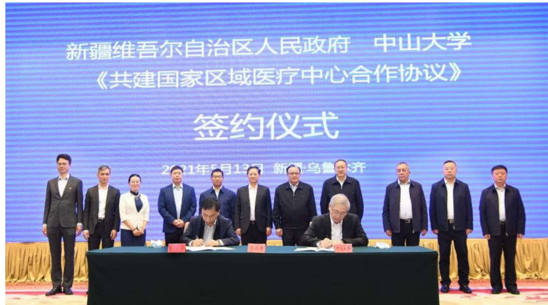
签约仪式现场

方将共同建设南疆首个国家区域医疗中心暨中山大学附属喀什医院（以下简称“国家区域医疗中心”）。该中心将依托中山大学强大的学科群综合实力及各直属附属医院在传染病相关学科的临床研究、人才培养、技术转化、技术辐射以及管理示范等方面的优势，切实推动新疆医疗人才培养，促进医疗服务水平的提升，守护新疆尤其是南疆各族群众的生命安全和身体健康。