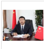
研究生导师-邱洪斌 邱洪斌：教授，医学博士，博... 【详细】