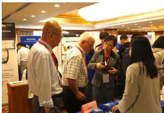
图为专家与赞助商交流

京公网安备 11010802012717 京ICP 备13002039 版权所有 中国毒理学会 访问统计 地址: 北京海淀区太平路27号 电子邮件: cst@chntox.org 电话: 010-66932387 传真: 010-68183899 邮编: 100850