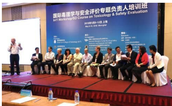
图为授课专家和特邀嘉宾进行案例分析及讨论交流