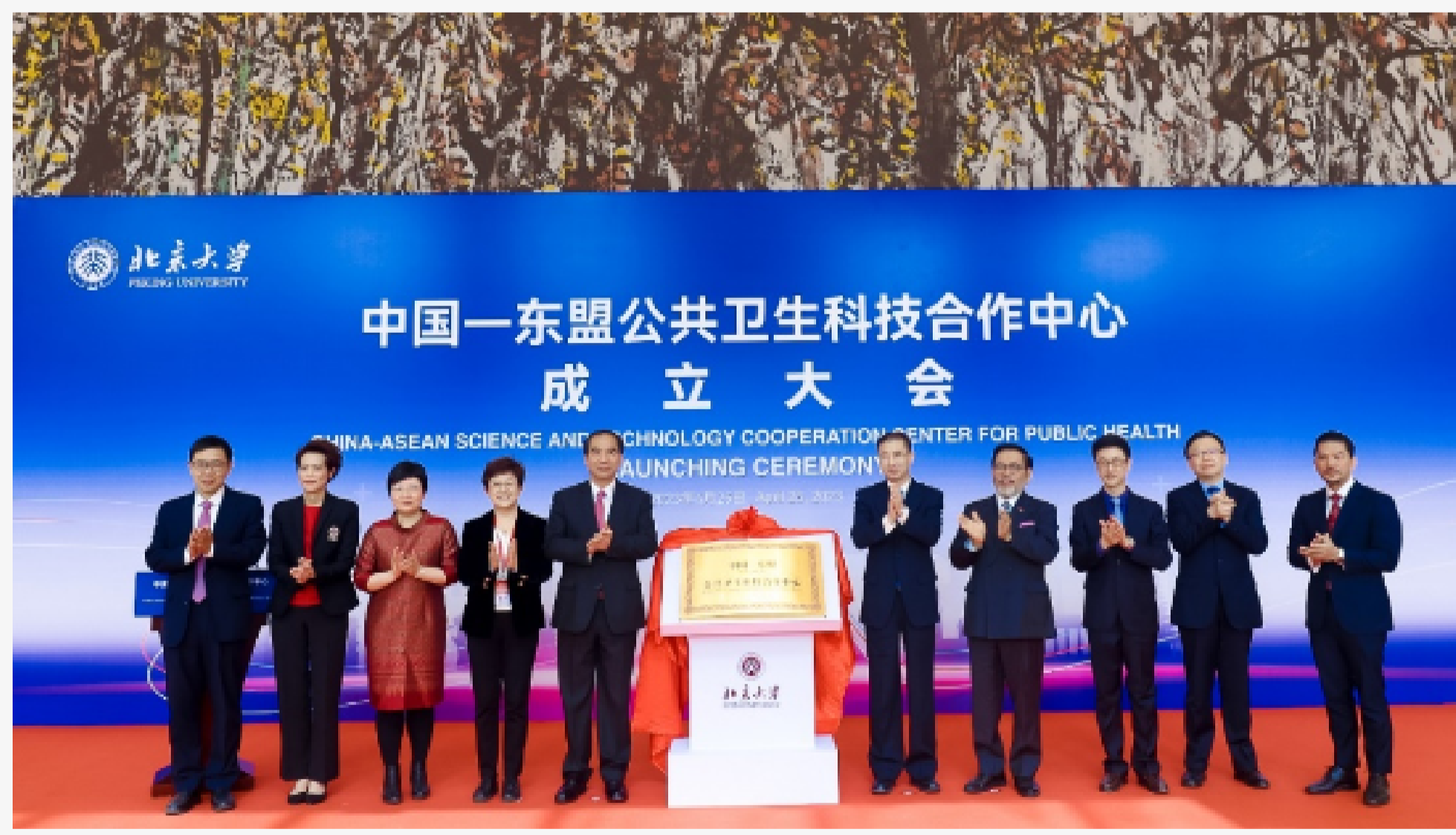
成立大会现场为中心揭牌

成立大会上，张广军、龚旗煌、周浩黎、乔杰共同为中国-东盟公共卫生科技合作中心揭牌。科技部国际合作司司长戴钢、教育部国际合作与交流司副司长贾鹏、国家卫生健康委员会国际合作司原司长、世界卫生组织助理总干事任明辉、泰国公使衔参赞陈善意、马来西亚教育参赞沙烈胡丁以及诺帕蕾一同见证中国-东盟公共卫生科技合作中心成立。