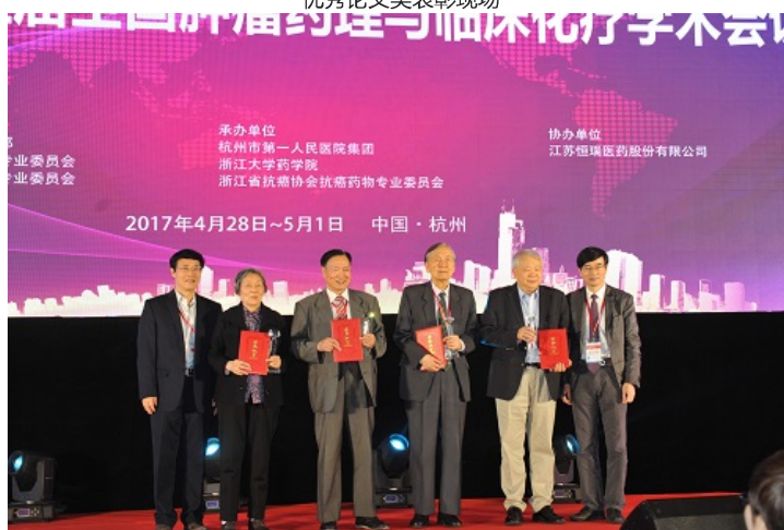
上海药物所胥彬教授、丁健院士获颁特别贡献奖