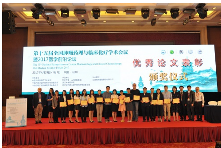
优秀论文表彰现场