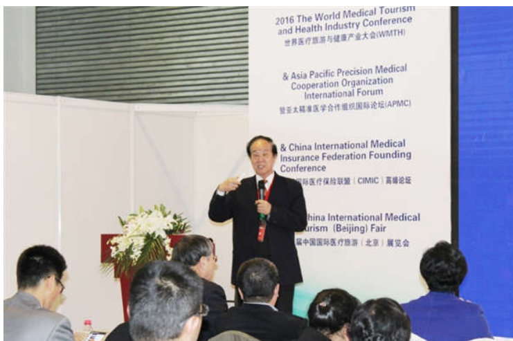
清华大学医院管理研究院创始人刘庭芳教授致辞

11月18日上午9点30分,清华大学医院管理研究院创始人、中国医疗保健国际交流促进会国际医疗旅游分会主任委员、中国国际医疗旅游联盟执行主席刘庭芳教授宣布大会开幕并致辞。卫计委主管的行业组织领导也出席了此次盛会。