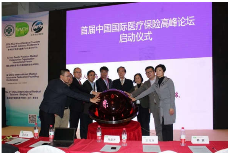
首届中国国际医疗保险高峰论坛启动仪式

国际医疗旅游发展的速度如此之快, 但是很多人在国际医疗旅游中还是面临很多的费用支付困难。为了解决国人的这个难题, 大会在最后一天(11月20日)举行了“首届中国国际医疗保险高峰论坛”, 同时尽快组建中国国际医疗保险联盟, 首先一点将惠及更多人享受到顶级的医疗资源, 不再担心因为一场重病或严重外伤甚至使家庭陷入破产的境地。