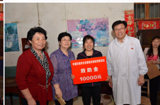
到癌症贫困患者家中慰问