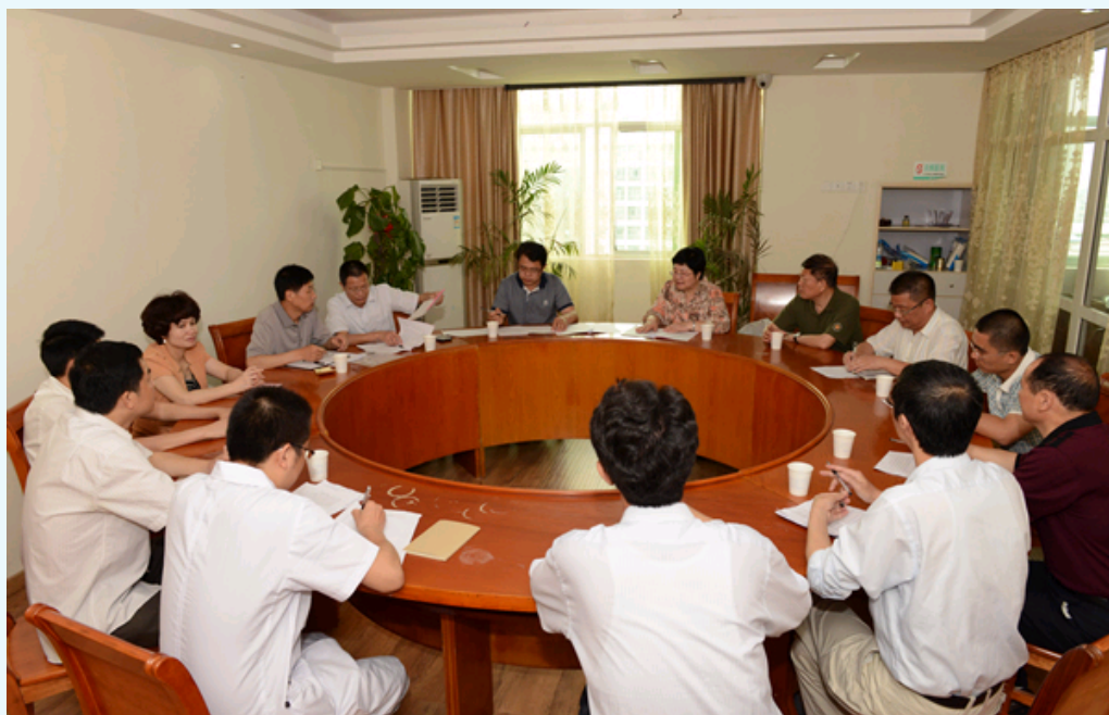
肿瘤防控资源调研座谈会现场