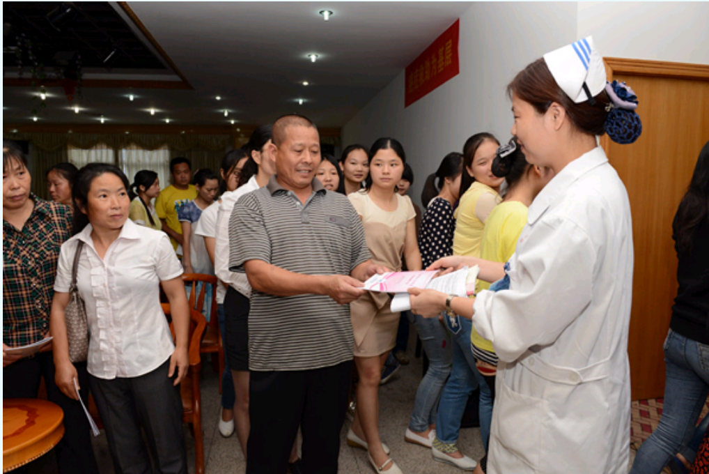
发放科普宣传资料