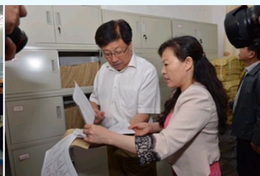
理事长郝希山院士在靖安县宫颈癌防治研究所考察