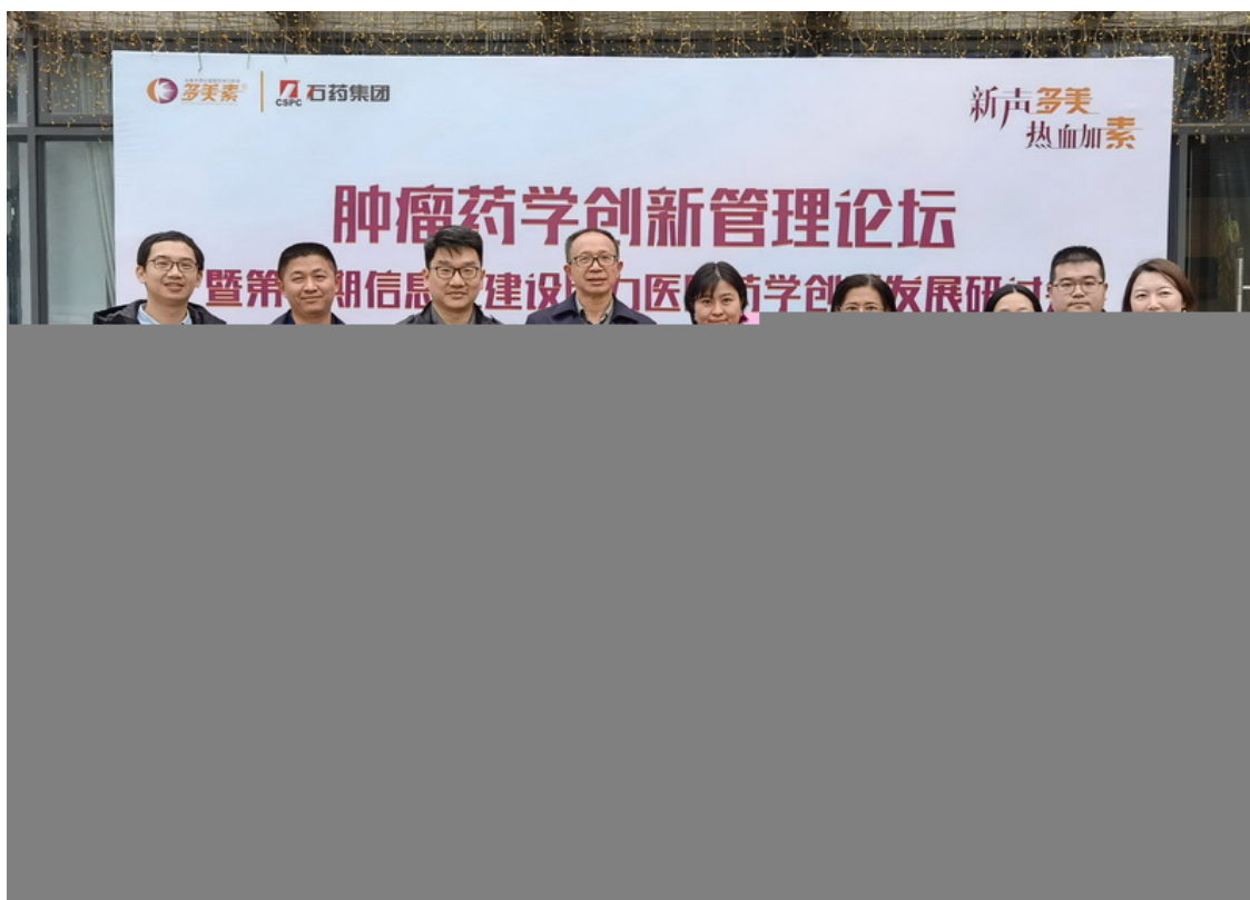
部分专家、代表合影