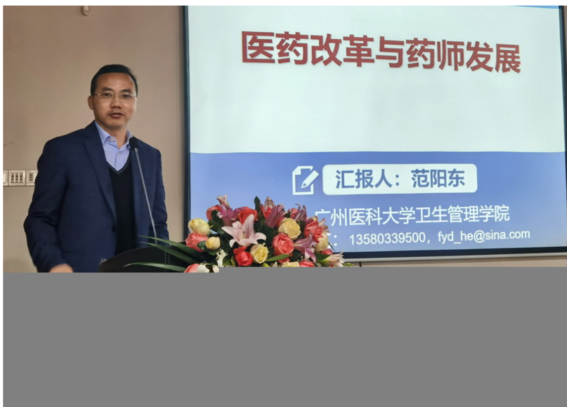
范阳东副院长做报告