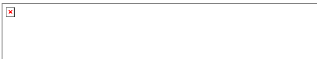
图10-1: 目前中国成年男女的性技巧情况

如果把5种爱抚与4种性交方式加在一起, 情况会稍微好一些; 可是也仍然有7.2%的中国成年人, 从来没有采用过其中的任何一种; 低于所有夫妻的平均数的人也仍然高达37.5%。这种状况也许是足够规矩了, 可是却直接降低了人们在性生活中的满意度; 降低了性高潮的频率; 也就是降低了整个性生活的质量。请看图10-1。