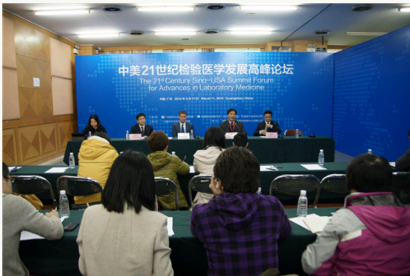
主办方召开新闻发布会现场。

3月11日，由广州医科大学金城检验学院、美国临床病理学会和广东省医学会检验分会联合举办的“中美21世纪检验医学发展高峰论坛”在广州召开，海内外检验界专家学者相聚一堂，共同探讨检验医学的现状与未来。