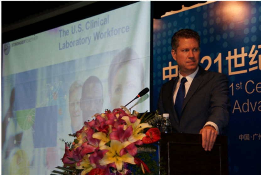
美国临床病理学会首席执行官霍莱德_布莱尔博士在演讲中。