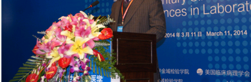
广州医科大学校长王新华在开幕式上致辞。