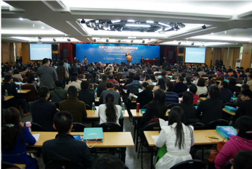
3月11日, 中美21世纪检验医学发展高峰论坛在广州召开。