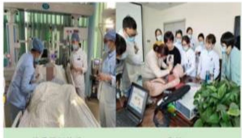
情景模拟教学 工作坊

员进行带教。基地对学员实施基于“ASK”模型的岗位胜任力的带教模式,对学员的知识、态度、技能进行全方位培训。采用情景模拟教学、工作坊、案例分享等形式对学员进行理论及临床实践操作学习,注重学员临床护理、质量管理、科研教学、护理人文等多方面的带教,培训效果显著。2020年基地圆满完成10名山东省护理学会首届神经护理专科护士的临床教学带教任务,受到了广大学员的一致好评。