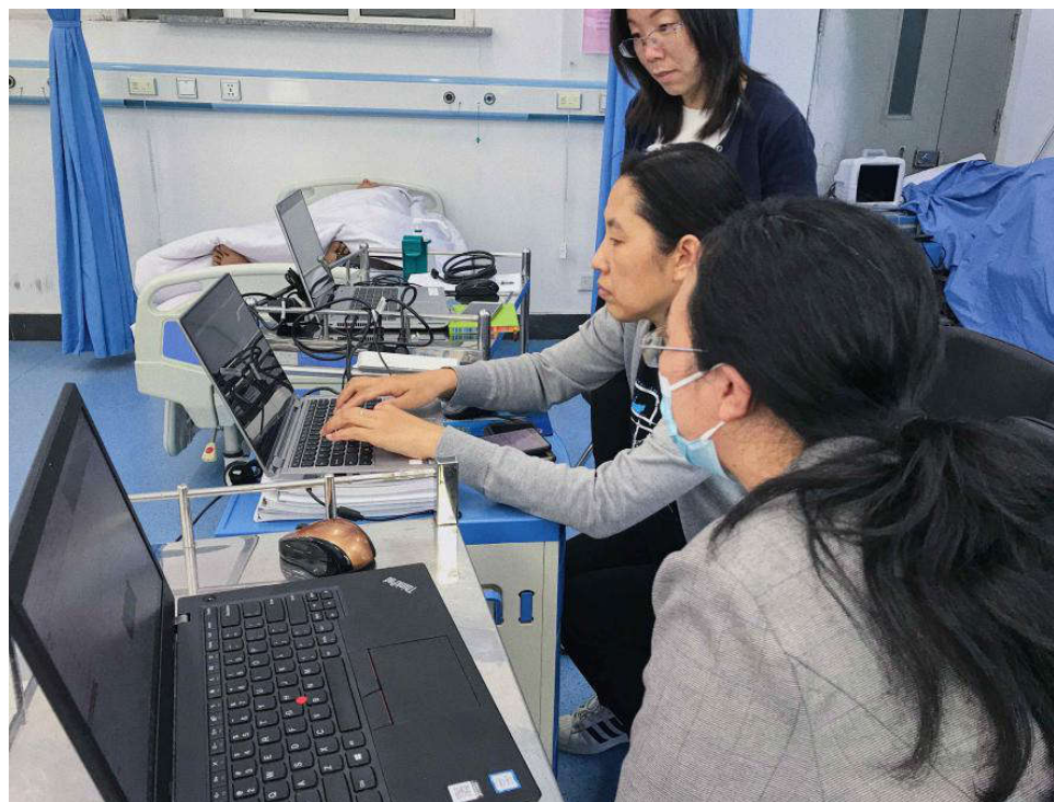
小组成员共同使用LLEAP系统编制情景模拟用病例