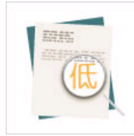
揭秘论文“低价”根源