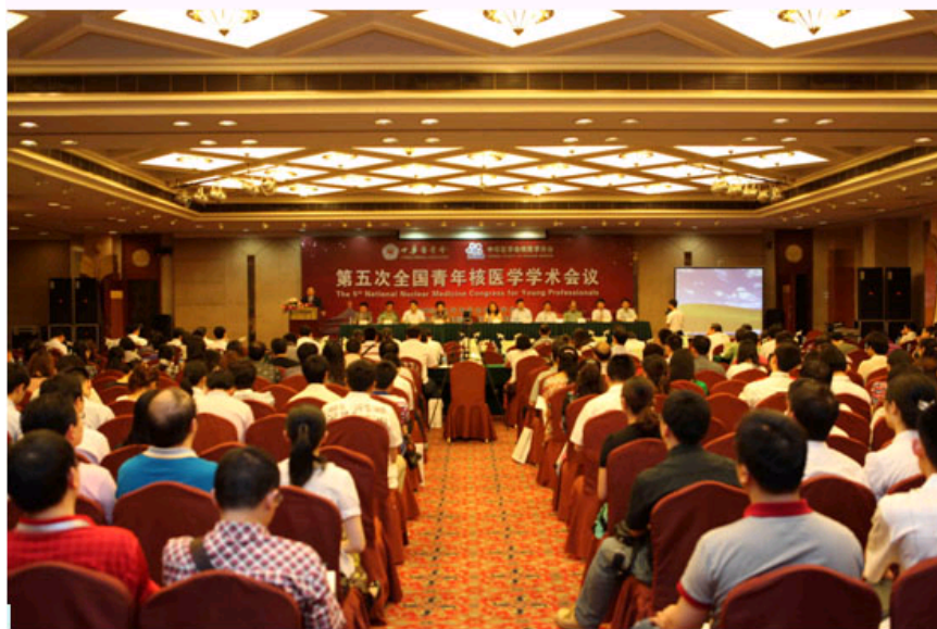
主任委员黄钢教授致开幕词《年轻就是优势 厚积才能薄发》