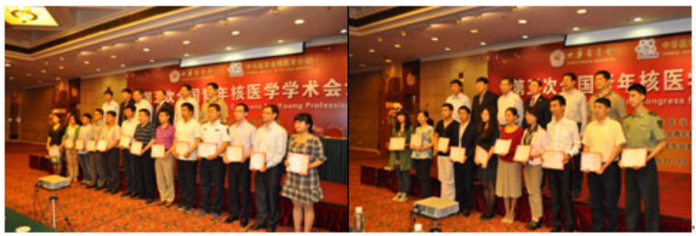
优秀中、英文论文及壁报交流颁奖分镜头