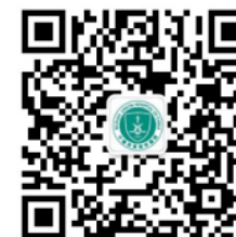
微信订阅号二维码