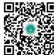
微信服务号二维码