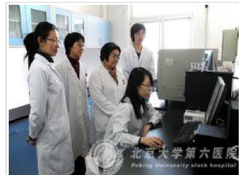
儿童精神病学研究

在儿童精神病学领域, 我院致力于注意缺陷多动障碍(儿童青少年和成人)及相关破坏性行为问题的病因和治疗研究, 开展儿童孤独症、儿童精神分裂症、儿童情绪障碍等儿童期重要精神障碍的临床研究, 先后承担卫生部、教育部、科技部、国家自然科学基金等多项基金课题, 在病因学、临床评定和治疗方面均取得较为突出的成绩。