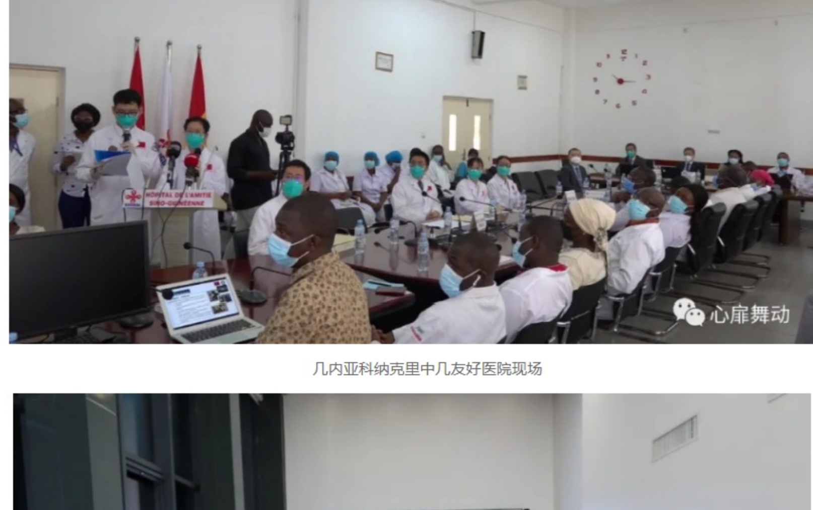
几内亚科克里中几友好医院现场

1月19日,中几友好医院神经医学中心建设项目总结暨揭牌仪式隆重举行,会议通过远程网络连线几内亚科克里中几友好医院及中国北京首都医科大学宣武医院,线上、线下同步举行。