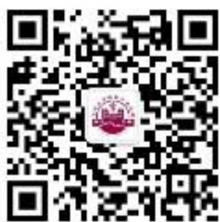
微信公众号二维码

传真：0755-89698999 邮编：518111 核酸、发热门诊及急诊服务：24小时 举报投诉邮箱：hyjc@szu.edu.cn 受理部门：深圳大学附属华南医院纪检审计室