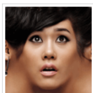
这种情况如何控制...