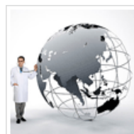
高薪诚聘皮肤科医生