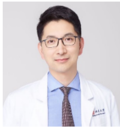
— 安 阳 —

截至 2022年12月底，结合医疗美容领域当下发展特点和编辑部实际情况，综合考虑学历、学位、研究领域、履职经历、研究成果等基本条件，经上级部门批准，最终选出符合条件的新晋编委8人，现公示如下：