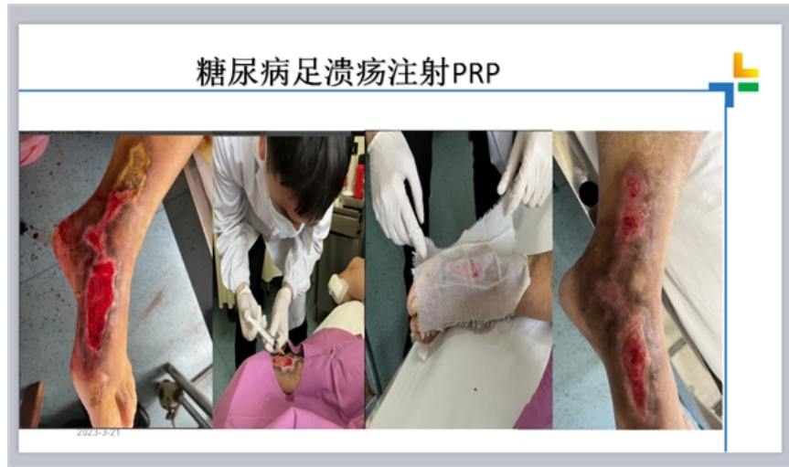
糖尿病足溃疡注射PRP十日效果

为了更加精准高效，我院PRP注射治疗可在超声引导下进行。利用实时超声，能清晰显示绝大部分外周神经及其周围的解剖结构。在可视下操作进针，既可避免损伤大的血管神经和脏器，确保治疗安全性，又能将药液直接注射于病变处或靶点处，大大提高了穿刺的准确性，并在确保疗效的前提下减少药物使用量，降低药物副作用。