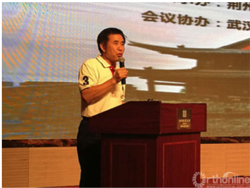
同济医院夏仁云教授进行了 人工关节置换的病例分享