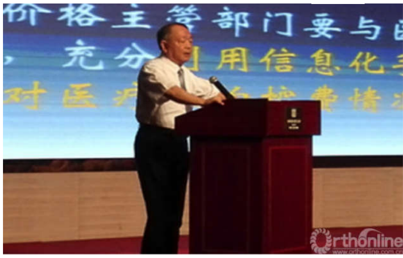
傅天明教授进行精彩演讲