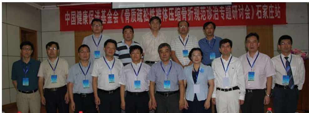
全体与会领导及嘉宾

整个辩论过程中，充满了浓浓的学术氛围，来自全国各地的讨论、点评嘉宾将自己的临床经验毫无保留地奉献给了听众。微信互动环节展示了两轮投票的结果及听众的广泛参与度和学习热情，某些带有争议的观点在专家激辩之后，听众的认可度趋于一致，达到了越辩越明的目的。大家纷纷表示：这种形式的辨析听众的参与度高，对单一疾病进行深度讲解和辩论可以真正解决临床问题，多地区多专家的经验分享使听会者受益匪浅，有一种意犹未尽的感觉。