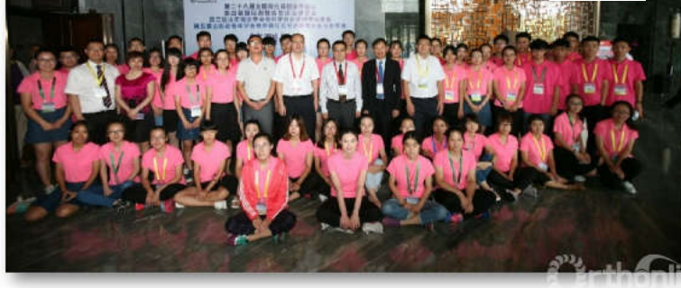
滨州医学院志愿者团队