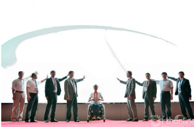
中国国际脊髓损伤日（9.5）启动仪式

本届会议以“胸椎脊柱脊髓损伤的治疗与康复”为主题。主要研讨胸椎肿瘤、胸椎畸形和退变以及胸脊髓损伤的康复等热点问题。