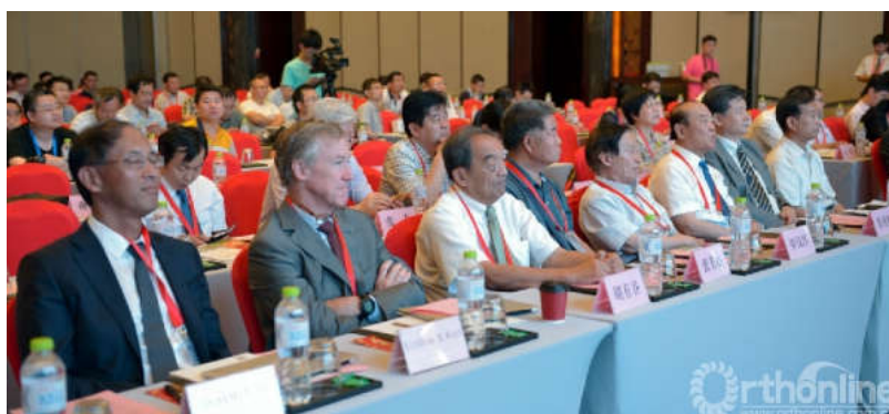
中外专家在学术研讨会会场