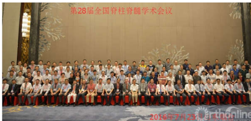
部分参会专家合影

本届大会共有76位专家发言,来自全国各地的500余名代表前来参会。各位专家对脊柱畸形、脊柱退变、外伤、感染等不同疾病的手术治疗以及脊髓损伤的规范化康复等论题进行了广泛深入的交流,对于推动我国脊柱脊髓损伤的学术进步具有重要意义。