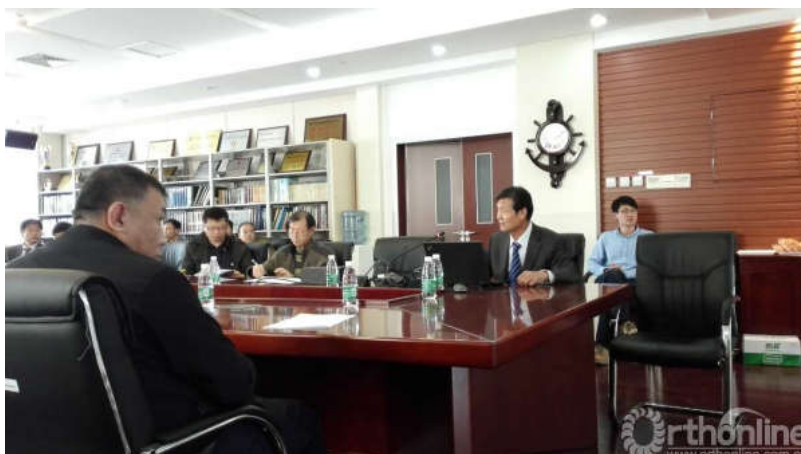
秦泗河教授做学术报告

秦泗河教授做了“肢体功能重建与外固定概论与相关问题探讨”的学术报告，从自身从事38年矫形外科主持33160例肢体畸形手术谈起，肢体矫形重建涉及医学、康复、辅具、机械、控制论、运筹学、进化论以及心理学、社会学等等学科，以“肢体残障大康复”为目标，探讨新的交叉领域应承担的使命和国际、国内的工作重点，为每一位参会者明确了目标，理清了思路。