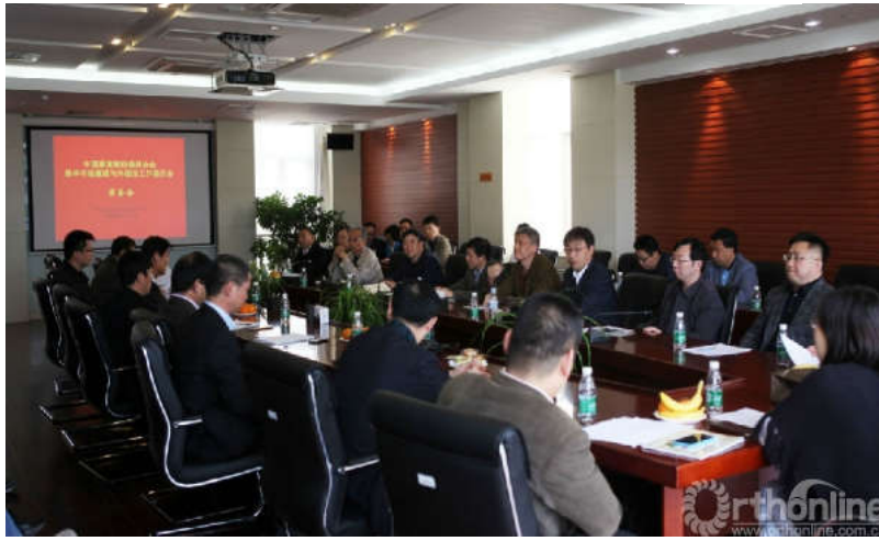
肢体功能重建与外固定工作委员会筹备会现场