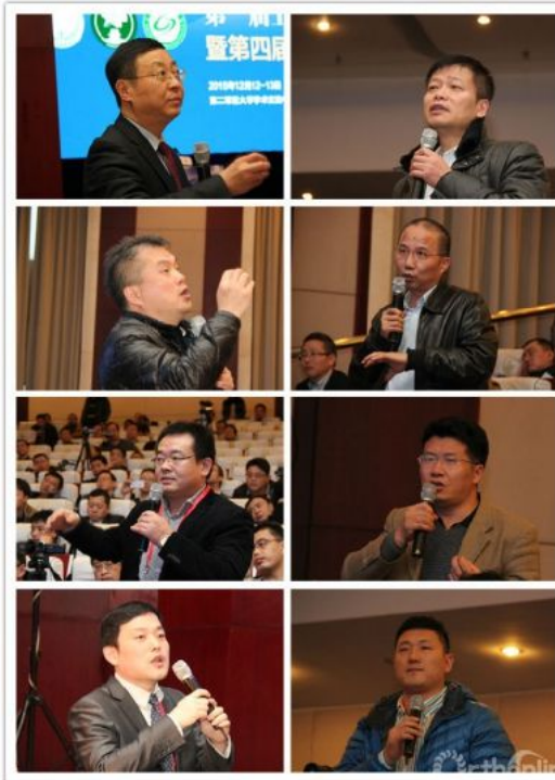
专家与学者间的互动

最后进行的病例荟萃环节讨论激烈，专家和学者之间进行了很好的互动，专家们把自己在临床上遇到的实际问题和经验总结分享给大家，达到了真正学习交流的目的。