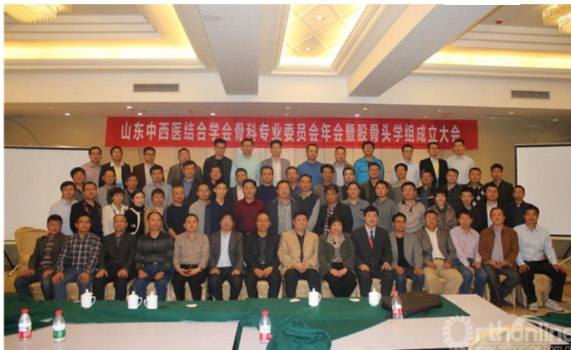
山东中西医结合学会骨科专业委员会股骨头坏死学组成员合影

领导专家们同时对临沂的骨科医务工作者提出了殷切的期望，加大中西医结合力度，不断深入开展骨科疾病的研究和努力为1000多万沂蒙老百姓的骨骼健康服务，真正的强壮沂蒙山的骨骼，挺起沂蒙山的脊梁。