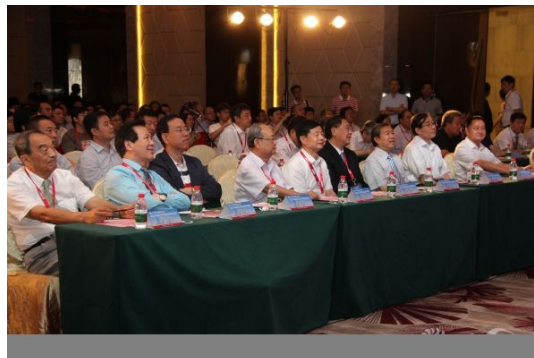
开幕式前排就坐嘉宾

在本次系列会议中，来自省内外的专家就脊柱外科、关节外科、创伤骨科、骨肿瘤、运动医学、手足外科、骨质疏松、微创外科及小儿骨科等专业的新技术及临床应用新进展，进行了广泛和深入的交流和探讨。