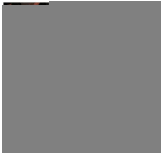
与会者认真聆听和记录

近年来，我国恶性肿瘤发病率居高不下，约五成恶性肿瘤患者最终会发生肿瘤的骨转移。戴尅戎院士提醒骨科医生，面对已转移的恶性肿瘤患者，不宜一律放弃，应考虑为其保留尽可能多的功能，延长其有效生命。而治疗转移骨肿瘤的手段不仅仅是手术，需坚持综合治疗，其治疗价值还会继续提高。同时，对肿瘤骨转移的机制、预防和治疗需要基础与临床研究的结合与转化。