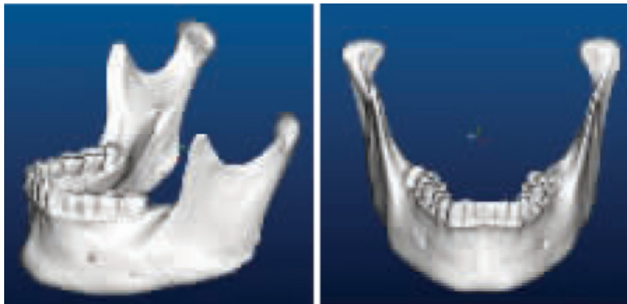
图3 重建的下颌骨表面轮廓 Fig.3 Reconstructed mandible surface

该下颌骨模型可以STL、IGES等文件格式输出，将模型的体或面结构转入相关CAD、CAE(computer