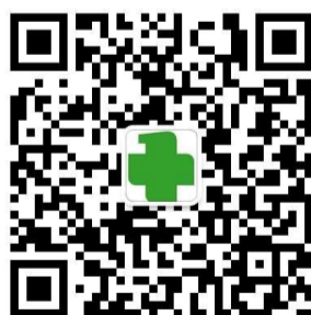
中国医科大学附属第一医院