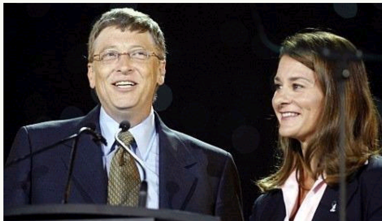
盖茨（左）和妻子梅琳达·盖茨

微软公司创始人比尔·盖茨和妻子梅琳达·盖茨1月29日宣布，今后10年会投入100亿美元用于痢疾、肺炎等危险疾病的疫苗研究和发放，以挽救更多发展中国家儿童的生命。