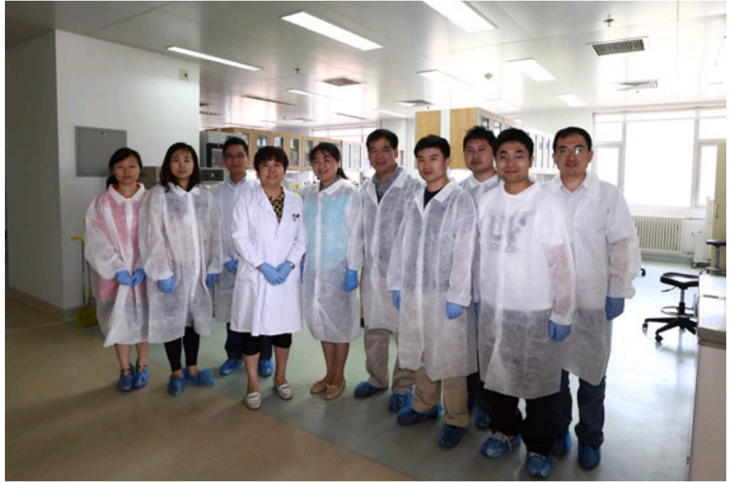
北京地区CDC学员在腹泻病室实验照片