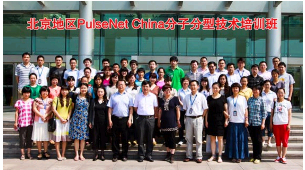
北京地区分子分型技术培训班合影