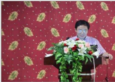
首届鄂西风湿论坛召开