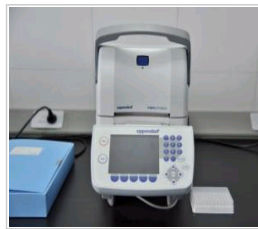
Eppendorf Vapo. prote