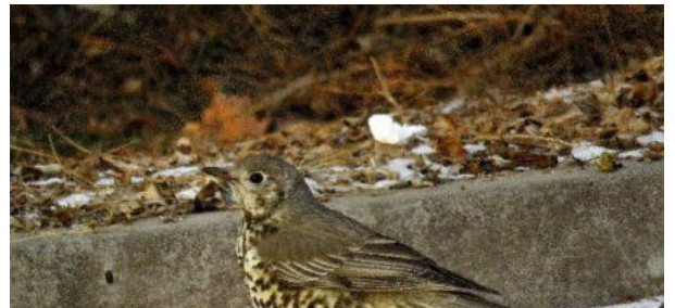
【新华社客户端甘肃频道】兰大师...