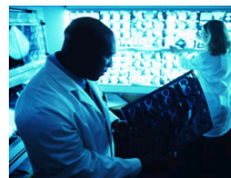
第十届全国激光生物

中护简介 | About CCUN | 诚聘英才 | 合作推广 | 广告服务 | 客服中心 | 网站律师 | 联系我们 | 友情链接 Copyright 2007-2008 CCUN.cn All Rights Reserved 中国护理网 版权所有