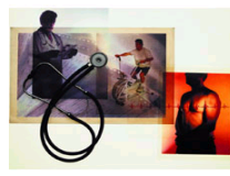
全国物理医学与康复