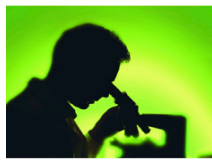
医疗事故的防范与处