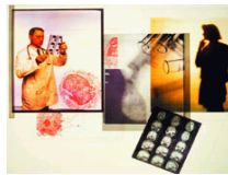
国际医学真菌大会北