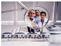
公共卫生突发事件管