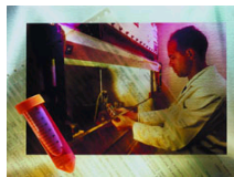
珠江·国际卒中论坛