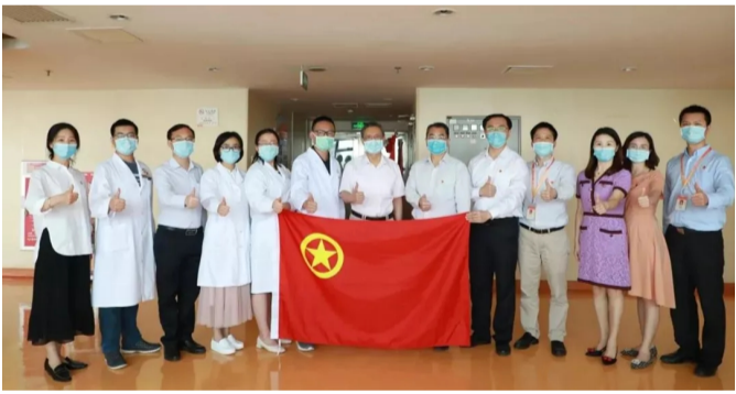
五四精神 传承有我 | 钟南山院士寄语青年人