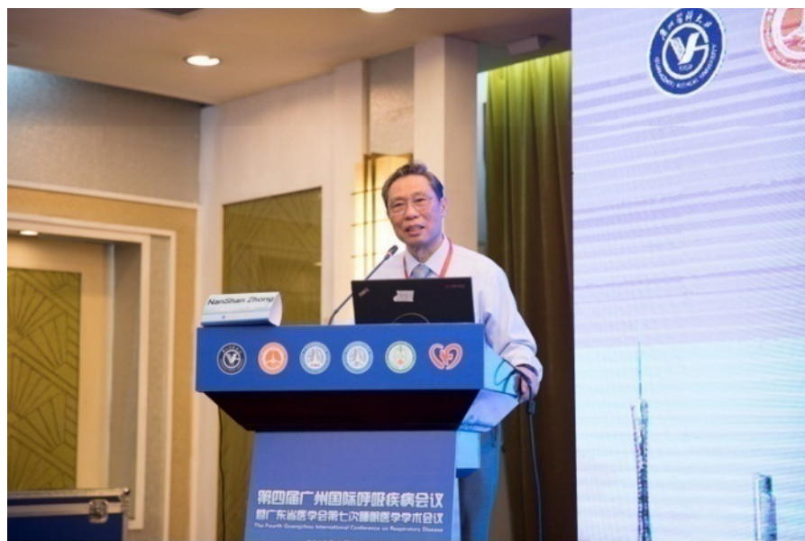
钟南山院士致开幕词

此次会议为期三天, 收到会议投稿近百篇。来自中国、美国、英国、法国、加拿大、澳大利亚、爱尔兰、丹麦、瑞士、香港等十多个国家和地区的近千位参会人员齐聚一堂, 围绕呼吸系统疾病特别是慢性阻塞性肺疾病、睡眠呼吸疾病及相关呼吸力学机制进行了深入的讨论交流。