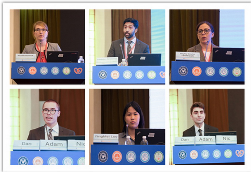
部分青年学者及帝国理工大学学生演讲