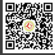
吕梁市人民医院 微信公众平台