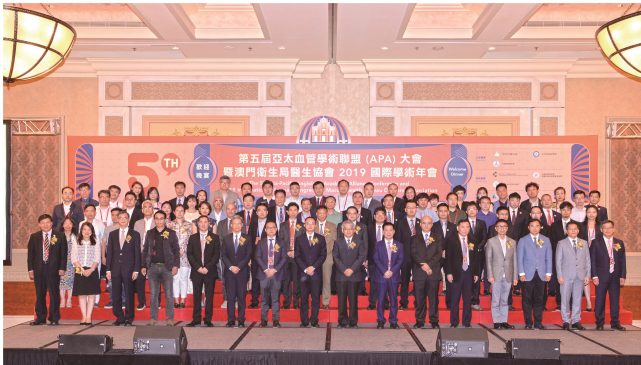
第五届亚太血管学术联盟大会嘉宾合影

大会秉承面向国际、聚焦前沿、荟萃精华的理念，随着其不断成长成熟，五年来已建成血管医学的重要品牌会议，在亚太地区独树一帜，并受到来自世界的关注。明年，全球最具权威、规模最大的血管外科学术盛会——血管和腔内血管问题、技术、视野研讨会（VEITH大会）将与APA大会联合举办血管及腔内血管论坛，将进一步促进APA和协和血管外科的不断发展。