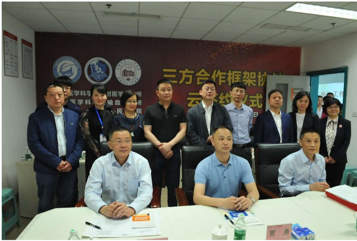
放射所、输血所和成都市第二人民医院签署协议现场