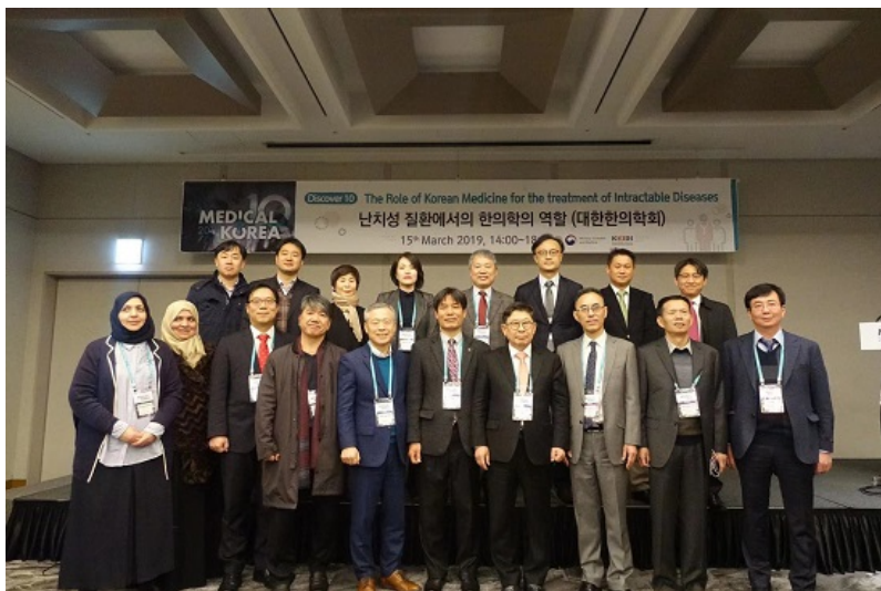
大韩医师协会分会场全体合影

此次会议规模庞大，设立了不同专业的众多分会场，来自中、美、德、意、俄、印、阿联酋等十余个国家的专家和韩国本土参会代表数千人出席了大会。