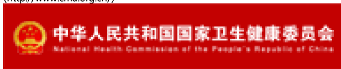
中华人民共和国国家卫生健康委员会