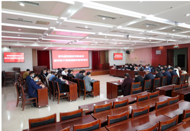
我院召开党风廉政建设专题...