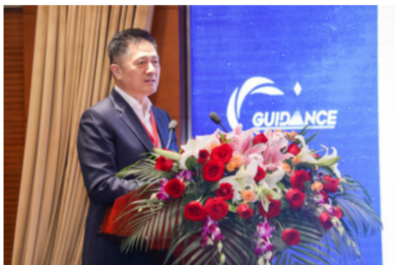
中国科学院院士樊嘉进行主旨演讲

“2003~2019年，全球有17部专门针对肝癌筛查的指南发布。”中国科学院院士、复旦大学附属中山医院院长樊嘉在主旨演讲中表示，随着我国指南制定在数量上迅速增加，如何提高临床指南质量变得尤为重要。我国迫切需要制定指南的规范和标准，以及对指南制定者进行方法学培训。