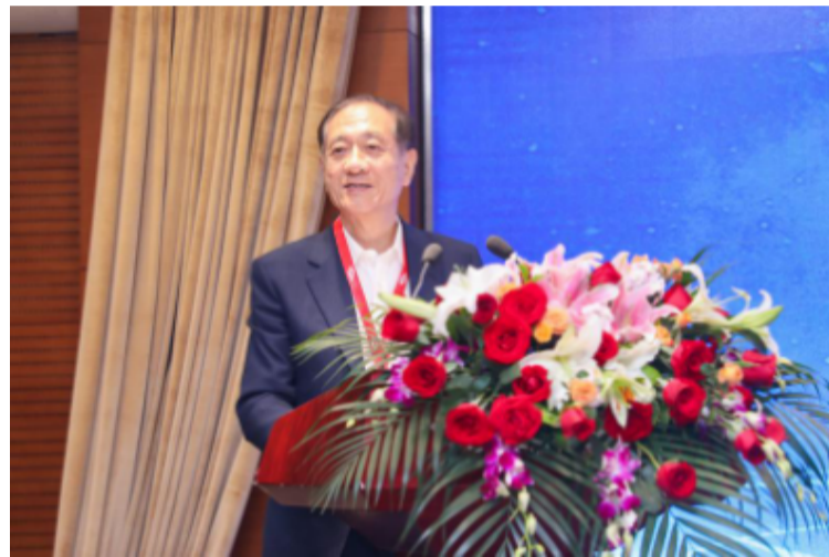
中国科学院院士韩启德致辞