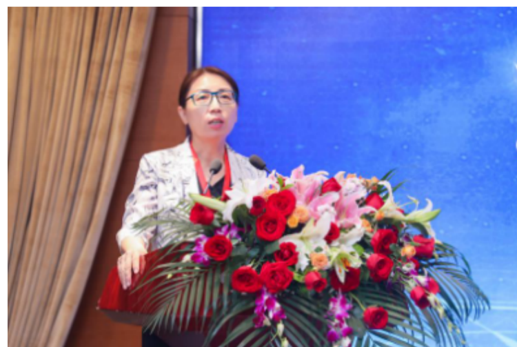
国家卫生健康委员会医政医管局局长焦雅辉致辞

“从2018年开始, 全国进行了三级公立医院的绩效考核, 从考核的情况来看, 虽然同是三级医院、三甲医院, 但差异还是比较大的。”国家卫健委医政医管局局长焦雅辉在启动会上谈到, 而指南的重要作用就是不管东部、西部还是中部医院, 不管是北京、上海大医院的医生, 还是县里的医生, 都可以遵循指南, 最大程度地保证患者得到同质化的医疗服务。