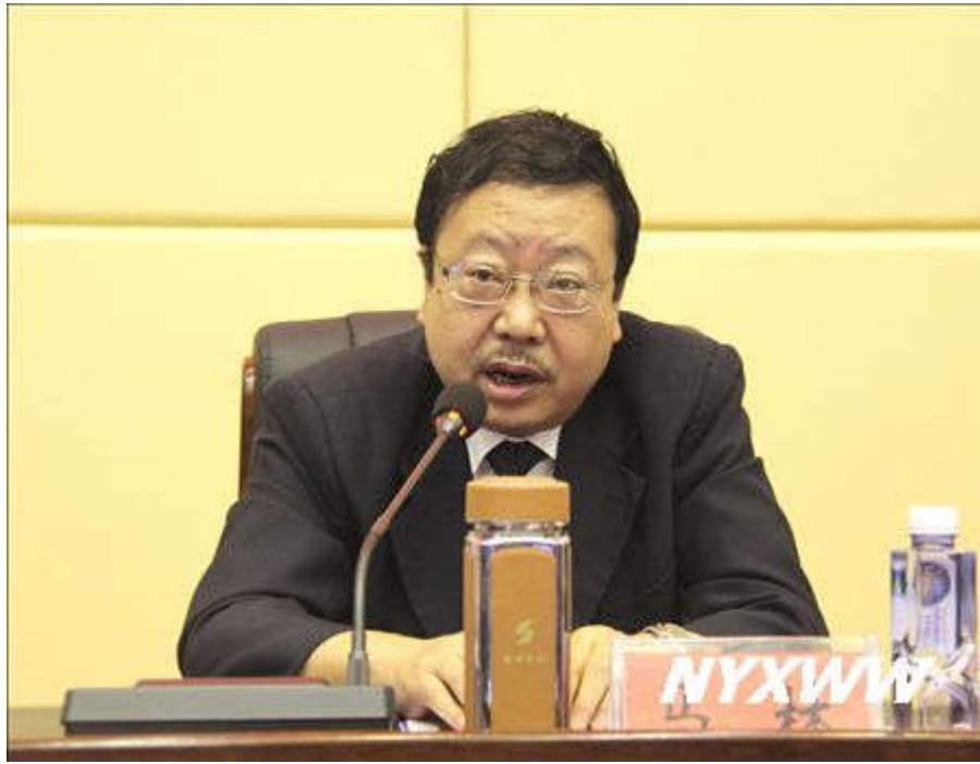
马林书记宣布论坛开幕